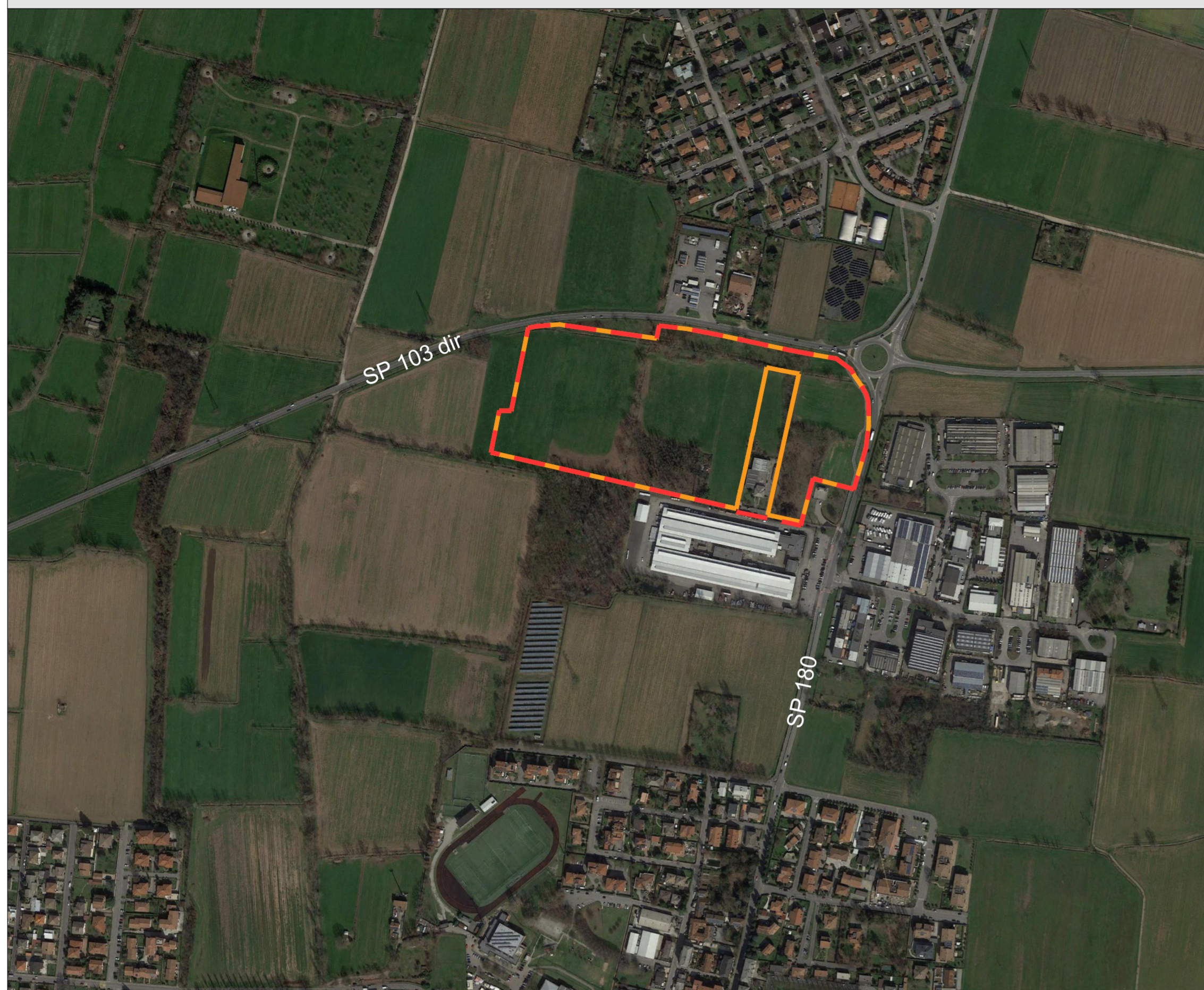
ORTOFOTO da GOOGLE EARTH _Scala 1:5.000